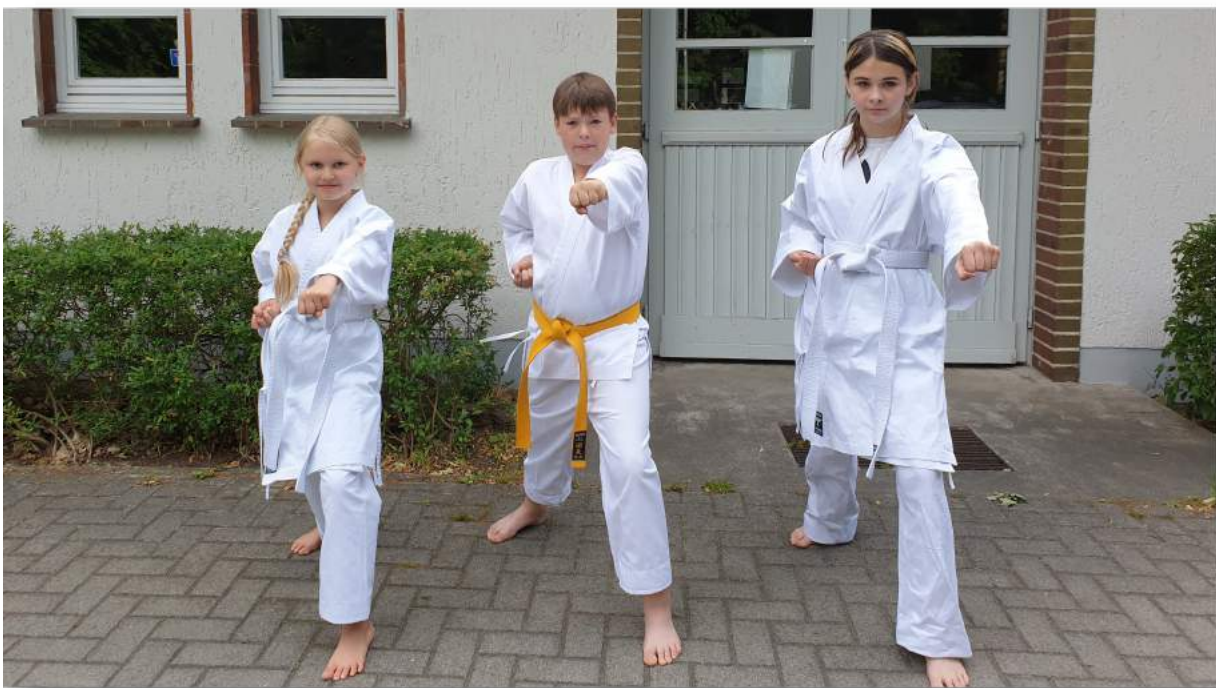
Drei der vier stolzen Prüflinge mit ihren neuen Weiß- bzw. Gelbgurten

In den Sommerferien konnten wir dann wieder etwas zum „Ferienpass“ beitragen – eine dreistündige Schnupperstunde für Kinder ab fünf Jahren. Die 15 Teilnehmer lernten ihren ersten Schlag, Block und Tritt, konnten Fallübungen auf der Matte ausprobieren und sich am Ende bei einer Runde Zirkeltraining nochmal richtig „auspowern“, bevor es wieder nach Hause ging. „Zombieball“ und Fangen im Krebsgang sorgten für Abwechslung zwischendurch.