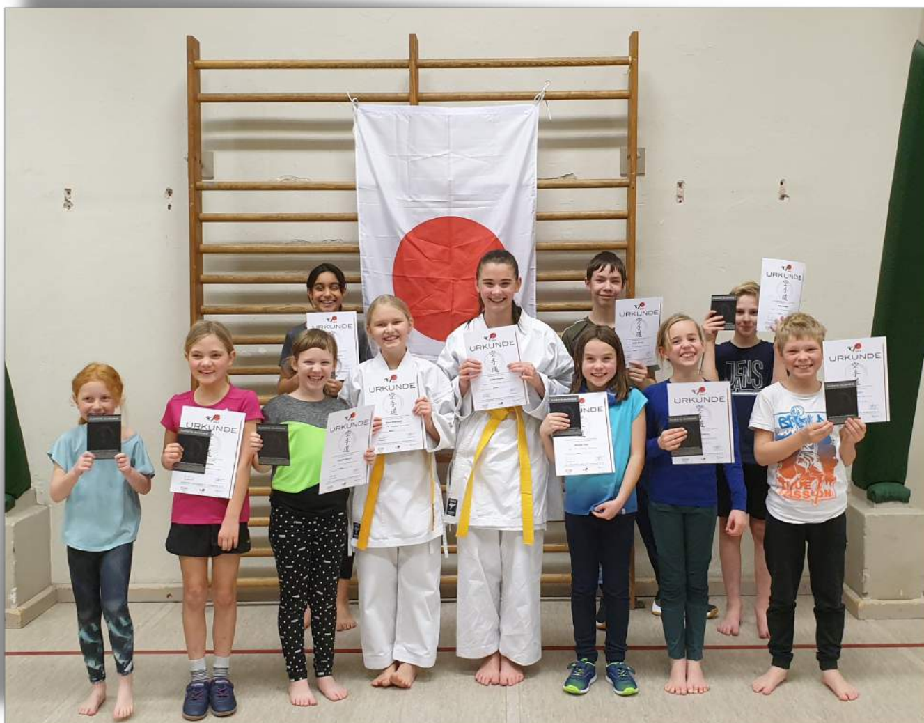
Die stolzen Prüflinge des Anfängerkurses und unsere zwei neuen Gelbgurte

In nur vier Monaten hatten sie sich die Teilnehmer des Anfängerkurses alle erforderlichen Techniken für den 9. Kyu (Weißgurt) angeeignet, sodass alle der angetretenen Prüflinge die Prüfung noch in diesem Jahr bestanden – eine Leistung, auf die man zu Recht stolz sein kann! Zum Schluss präsentierten dann zwei der nun schon „alte Hasen“ erneut ihr Können und erhielten verdient ihre Gelbgurte.